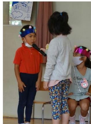
フォレスター お母さん