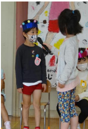
つばさ (新幹線) たまご