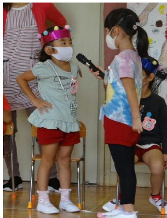
メロンジュース リンゴ